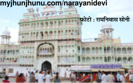
शान निराली है, टाबरिया नै नित नई देवो थे सौगात म्हारी दादीजी, सिर पर थे म्हारे रखदो दया को हाथ दादी माँ, आज बंट रही है बधाई दादी के जन्म दिन की सहित अन्य भजनों ने दादी भक्तों को खुब आनन्दीत किया। सजे धजे मां के दरबार में मां भगवती राणी सती दादी के नाम से मंगलमय सच्चे दरबार में श्रद्धालु भक्तों ने अपना शीश नवाया पूजा अर्चना कर मनोतिया मांगी।